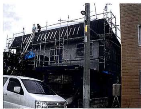
★屋根は板金を張替、パネル設置のため補強。