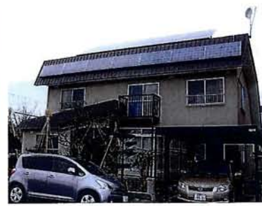
★南向き屋根に22枚の太陽光パネルを設置しました。